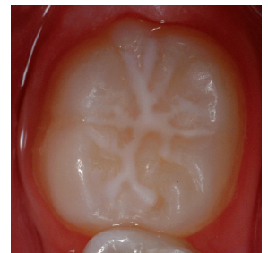
Abb. 1: Intakte Fissurenversiegelung.

Als wesentlicher Faktor vor einer Fissuren- und Grübchenversiegelung ist das Erscheinungsbild der betreffenden Zahnfläche einzuschätzen. Ist