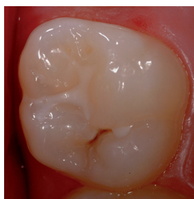
Abb. 2: Teilweiser Verlust der Versiegelung an einem oberen Backenzahn mit verfärbter Querfissur. Eine Nachversiegelung sollte vorgenommen werden.

Die Behandlung bei der Fissuren- und Grübchenversiegelung dauert in der Regel nur wenige Minuten und erfordert keine invasiven, in die Zahnhartsubstanz eingreifende Behandlungsschritte.